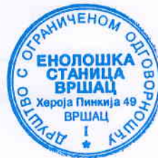
Miodrag Kertes, dipl.inž. tehn.

Napomena: Izjava o usklađenosti rezultata ispitivanja je doneta na osnovu Pravila odlučivanja 1.